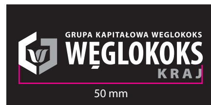
5 Wersja monochromatyczna - kontra