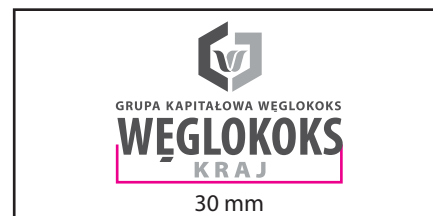
2 Wersja monochromatyczna