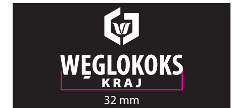
6 Wersja achromatyczna - kontra