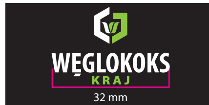
4 Wersja barwna - kontra