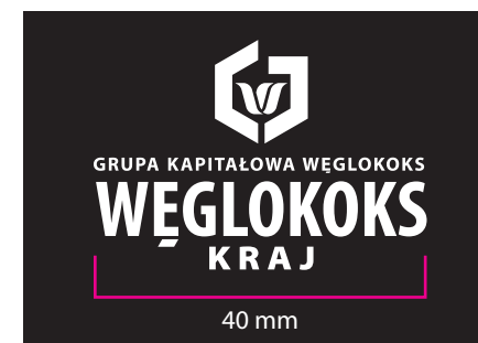
6 Wersja achromatyczna - kontra