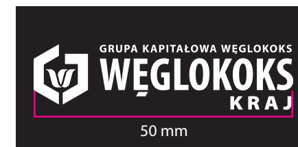
6 Wersja achromatyczna - kontra