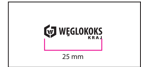
3 Wersja achromatyczna czarna