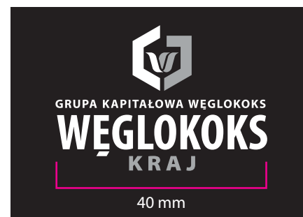
5 Wersja monochromatyczna - kontra