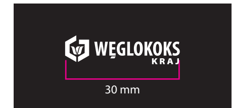
6 Wersja achromatyczna - kontra