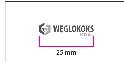
2 Wersja monochromatyczna