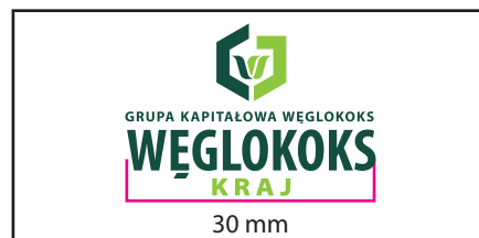
1 Wersja barwna

Wersje w kontrze wymiar podstawy logo 32 mm. Należy zwrócić uwagę na warunki technologiczne odwzorowania logo, dobierając wymiar minimalny tak aby uniknąć "zalewania" elementów logo przez tło.