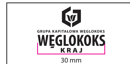
3 Wersja achromatyczna czarna