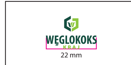
2 Wersja monochromatyczna