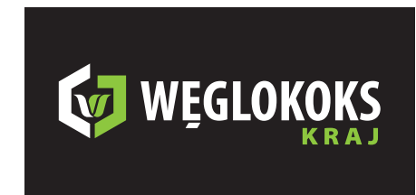
9 Opcja barwna specjalna - kontra II