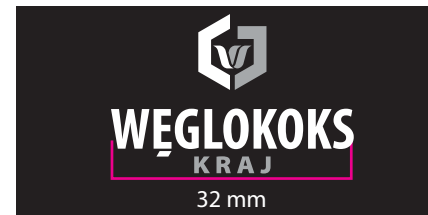
5 Wersja monochromatyczna - kontra