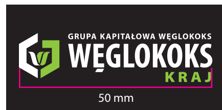
4 Wersja barwna - kontra