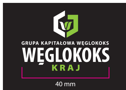
4 Wersja barwna - kontra