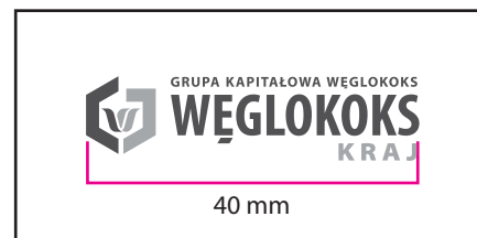
2 Wersja monochromatyczna