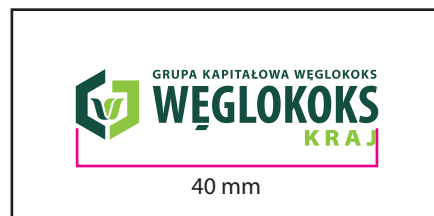
1 Wersja barwna

Wersje w kontrze wymiar podstawy logo 40 mm. Należy zwrócić uwagę na warunki technologiczne odwzorowania logo, dobierając wymiar minimalny tak aby uniknąć "zalewania" elementów logo przez tło.