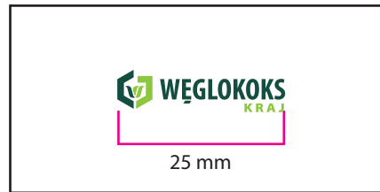
1 Wersja barwna

Wersje w kontrze wymiar podstawy logo 30 mm. Należy zwrócić uwagę na warunki technologiczne odwzorowania logo, dobierając wymiar minimalny tak aby uniknąć "zalewania" elementów logo przez tło.