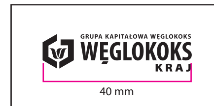
3 Wersja achromatyczna czarna