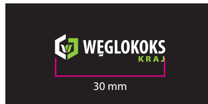
4 Wersja barwna - kontra