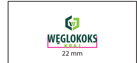
3 Wersja achromatyczna czarna