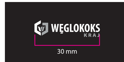
5 Wersja monochromatyczna - kontra