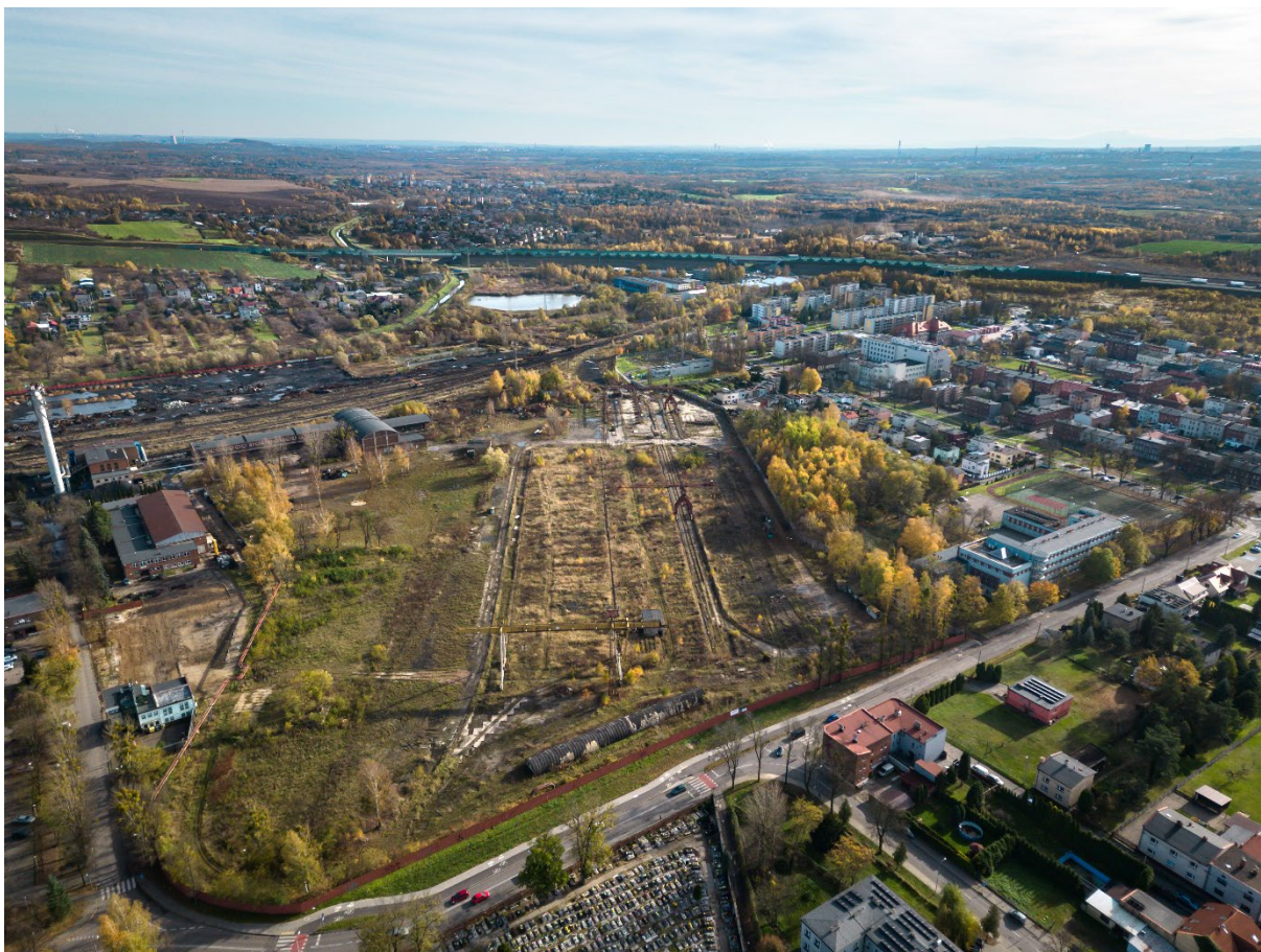
Infrastruktura sąsiadująca z terenem po placu drzewa

Nieruchomość zlokalizowana jest przy ulicy Generała Ziętka jest w centralnej strefie miasta w nieznacznej odległości od punktów handlowych, usługowych i użyteczności publicznej. Teren jest dobrze skomunikowany z infrastrukturą drogową i miejską.