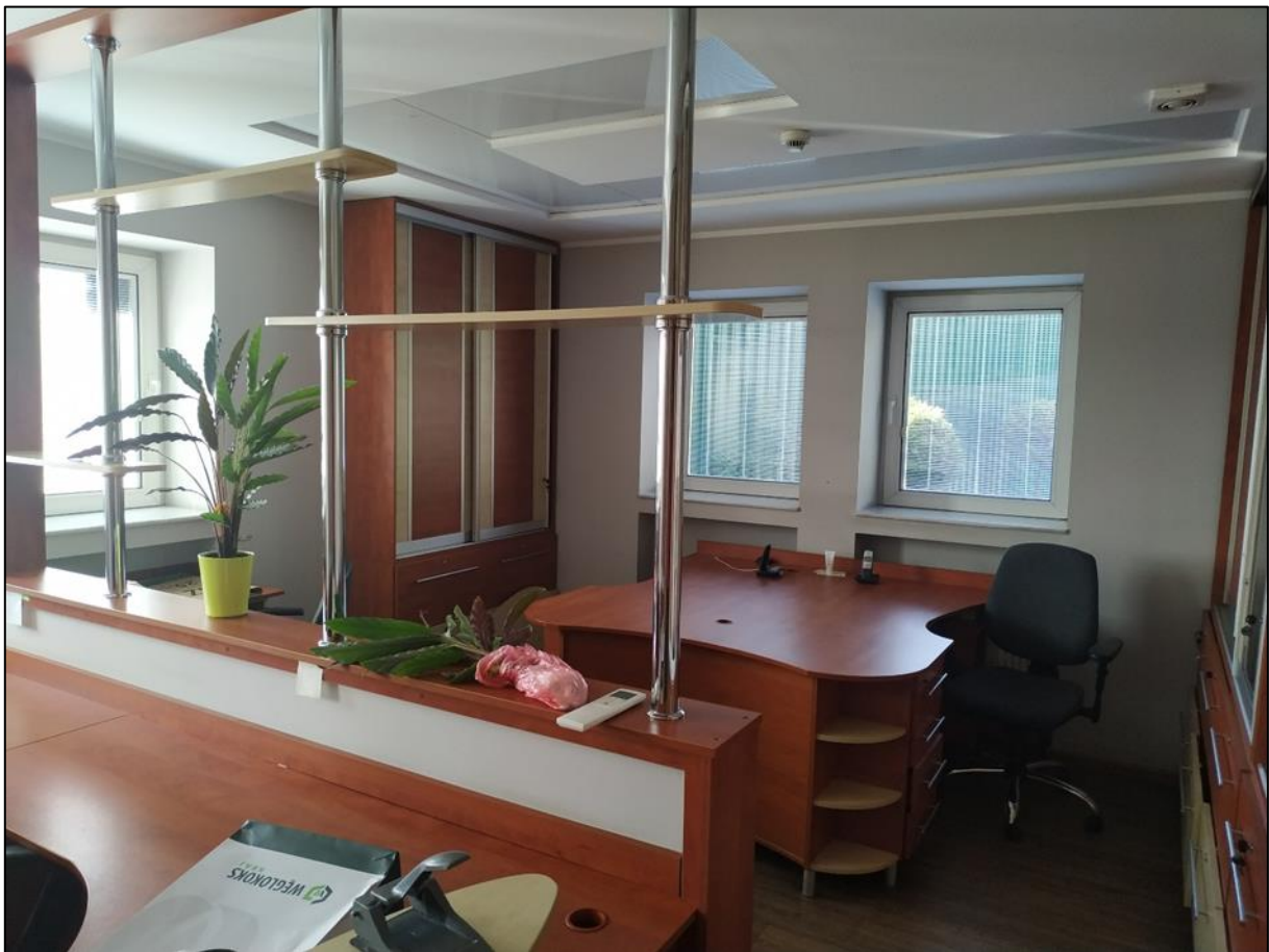
Adaptacja pomieszczeń na biura