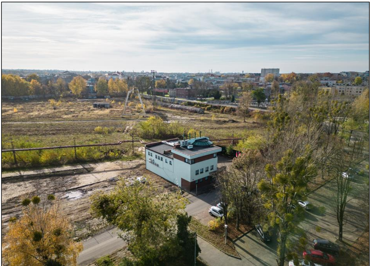
W tle strona południowo-zachodnia miasta Piekary Śląskie