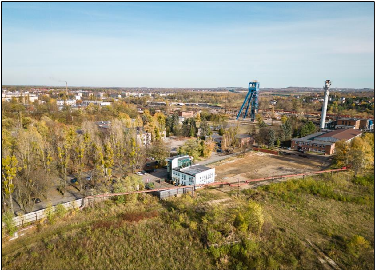
Budynek na tle miasta i szybu Julian IV