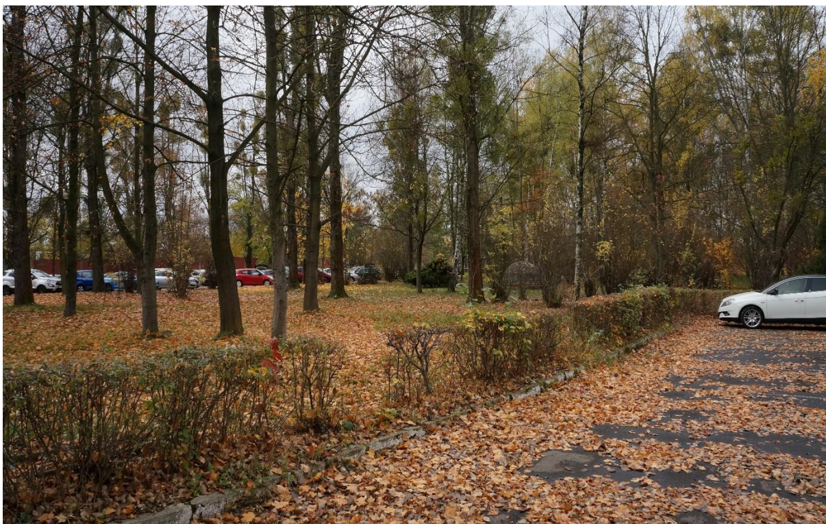
Widok od strony budynku administracyjnego byłej kopalni