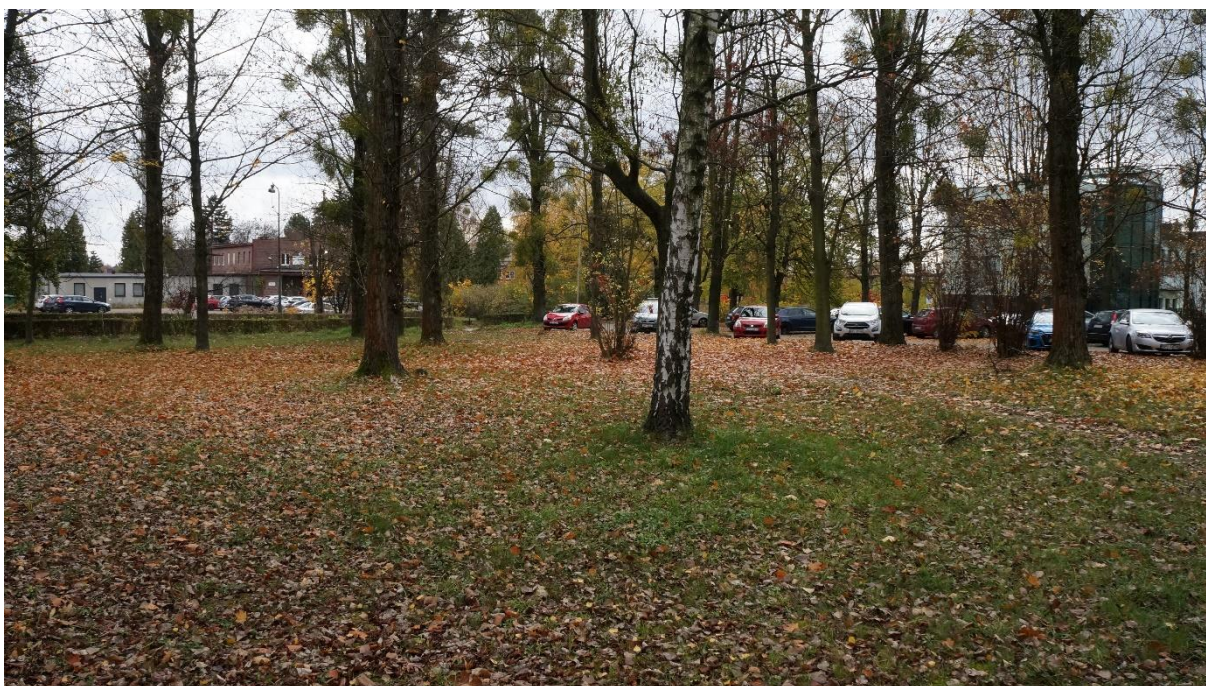
W tle miejsca parkingowe przynależne do nieruchomości