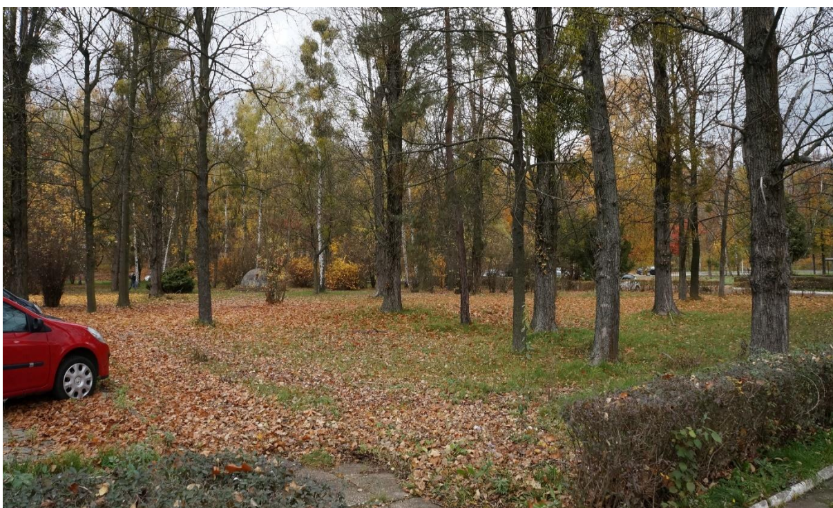
W tle ulica Gen. Ziętka