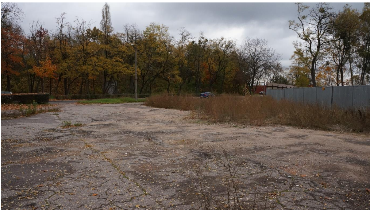
Wjazd od ulicy Gen. Ziętki