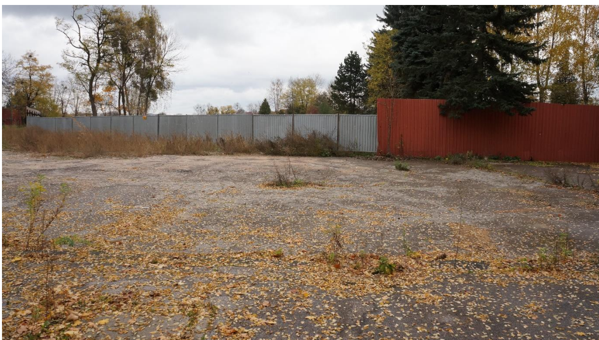
W tle za ogrodzeniem tereny byłej kopalni Julian