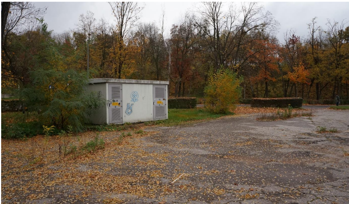
Działka ze stacją transformatorową, w tle ulica Gen. Ziętka