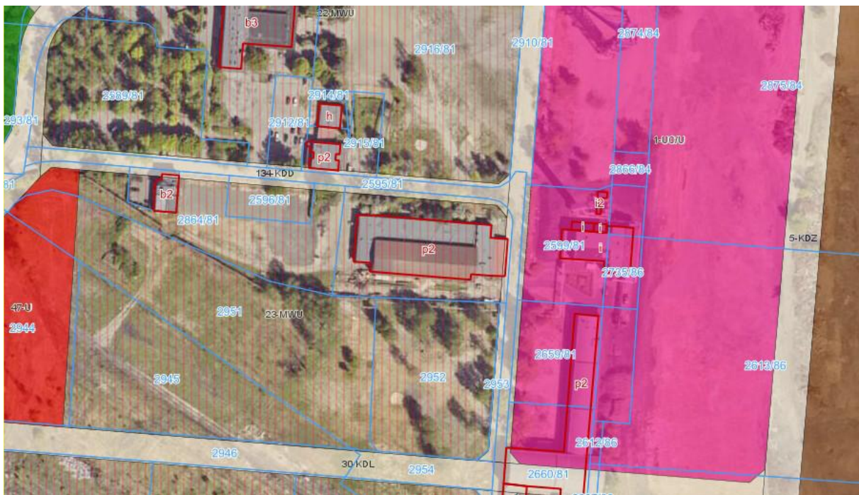
MPZP Miasta Piekary Śląskie w obrębie oferowanej nieruchomości gruntowej

Nieruchomość położona jest na obszarze, który według zapisów miejscowego planu zagospodarowania przestrzennego przyjętego Uchwałą Nr LIII/574/22 Rady Miasta Piekary Śląskie z dnia 29 września 2022 r. przeznaczony jest jako MWU: Zabudowa mieszkaniowa wielorodzinna, zabudowa usługowa, tereny infrastruktury technicznej w tym stacje uzdatniania wody, garaże podziemne i wielopoziomowe, teren drogi 133-KDD: drogi publiczne klasy dojazdowej oraz teren drogi 134-KDD: drogi publiczne klasy dojazdowej.